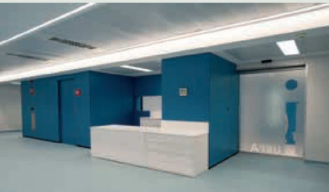
Actuación para la implantación del bloque quirúrgico de la Unidad de Cirugía mayor del Hospital General de Castellón.

estamos convencidos de que los CAEs son un mecanismo eficaz no solo para motivar a propietarios e inversores, sino también para ayudar a que el sector avance hacia un futuro más sostenible y alineado con los objetivos climáticos de la Unión Europea. ■